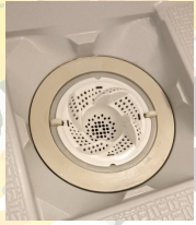
排水溝の蓋は外しています

「しっかりお掃除」を助ける「ちょこっとお掃除」をできれば習慣にして、気持ちの良いお風呂タイムを過ごせたらいいですね(*^*)