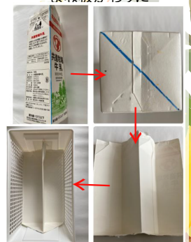
ケースの仕切りに