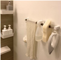
浴室内に置く小物は最小限にして、お掃除グッズもすぐ手に取れるように。

整理収納のお悩みにお答えします。以下のメールアドレスにタイトル「整理収納お悩み相談」としたうえで送りください。ひまわりサービスの整理収納アドバイザーがお答えします。